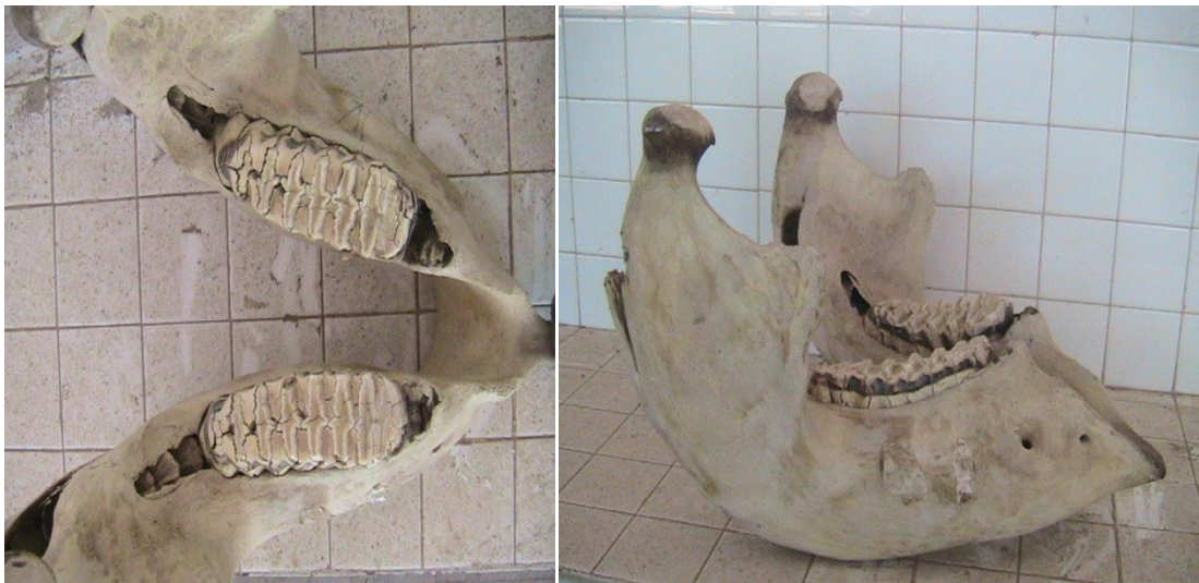
Molaire de l'éléphant